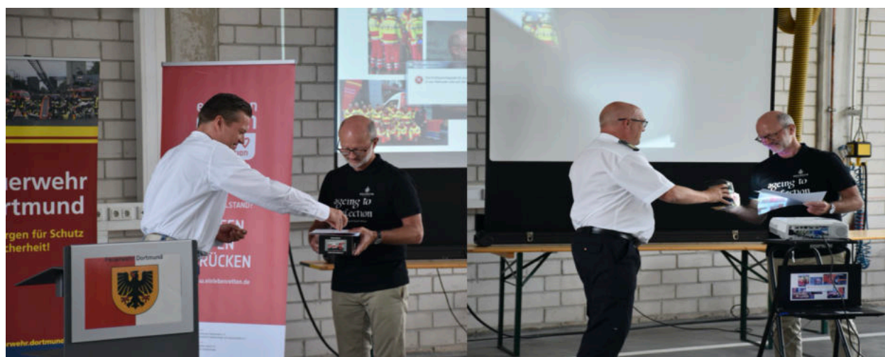
In besonderen Zeiten: Übergabe Geschenk, Urkunde und Nadel mit gewissem Abstand

Der neue Ruheständler bedankte sich bewegt und versprach, sich auch in Zukunft weiter für den Rettungsdienst bei Bedarf einzubringen, ins besonders für die Aktionswochen – Prüfen – Rufen – Drücken.