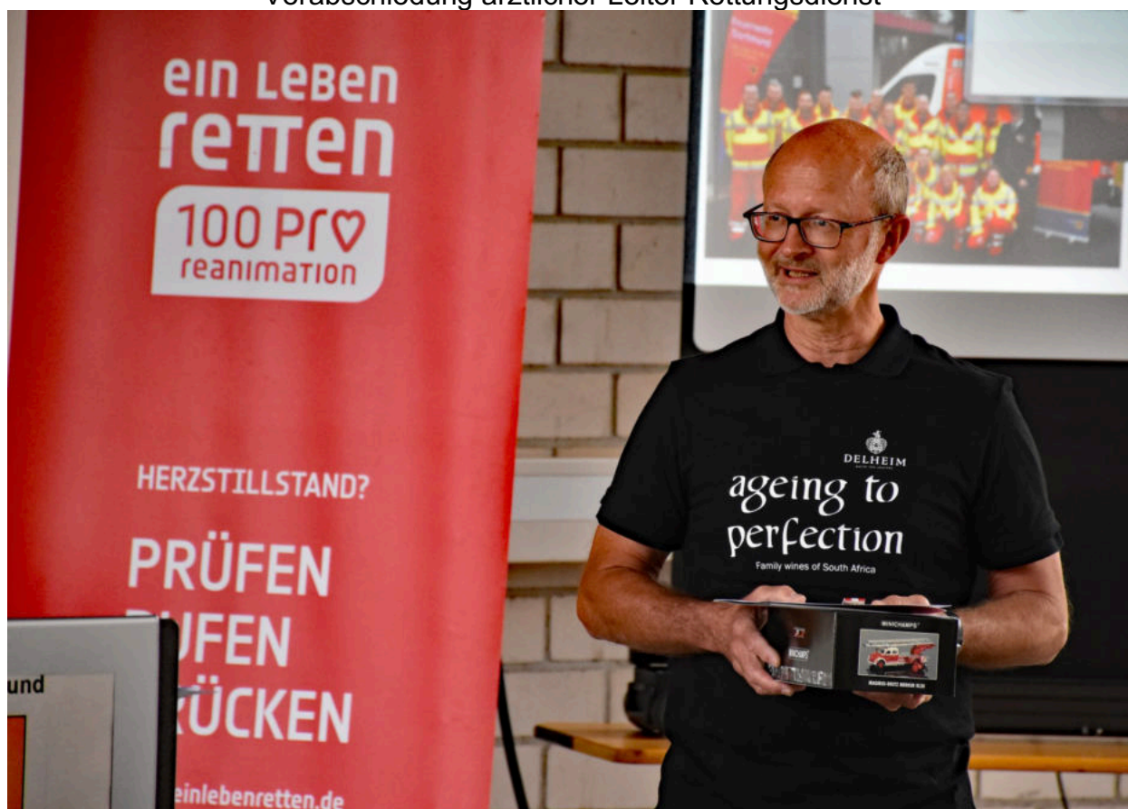
Der Ruheständler bei seiner Dankesrede

Verabschiedung ärztlicher Leiter Rettungsdienst