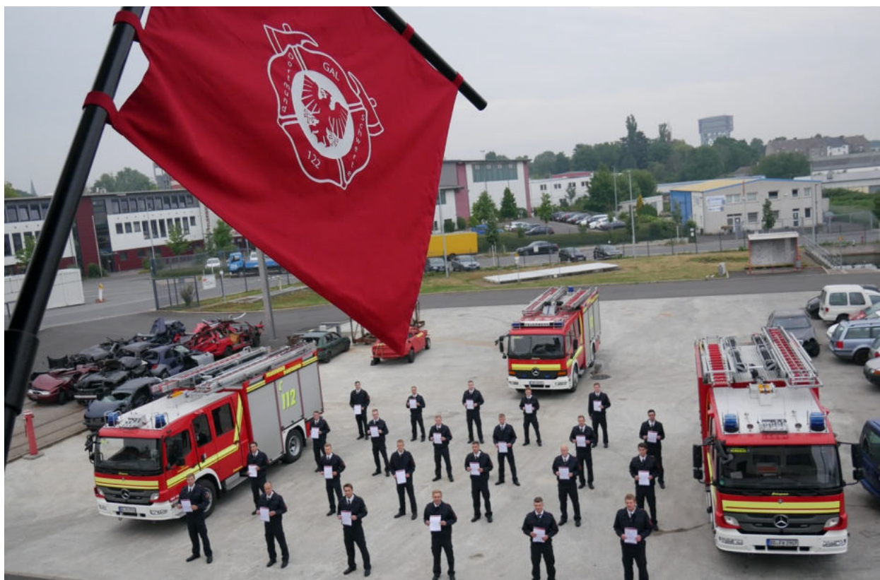
Besondere Aufstellung in besonderen Zeiten – Die neuen Mitglieder

Am 01.04. 2020 hatte mit dem GAL 122 ein neuer Grundlehrgang begonnen. In dem 23 Mann starken Lehrgang sind 21 Dortmunder Brandmeisteranwärter. Die „Neuen“ wurden in den Stadtfeuerwehrverband Dortmund e. V. aufgenommen. In der Regel wird die Begrüßung der Grundlehrgänge und die Übergabe der Verbandsausweise durch den Vorsitzenden des Stadtverbandes,