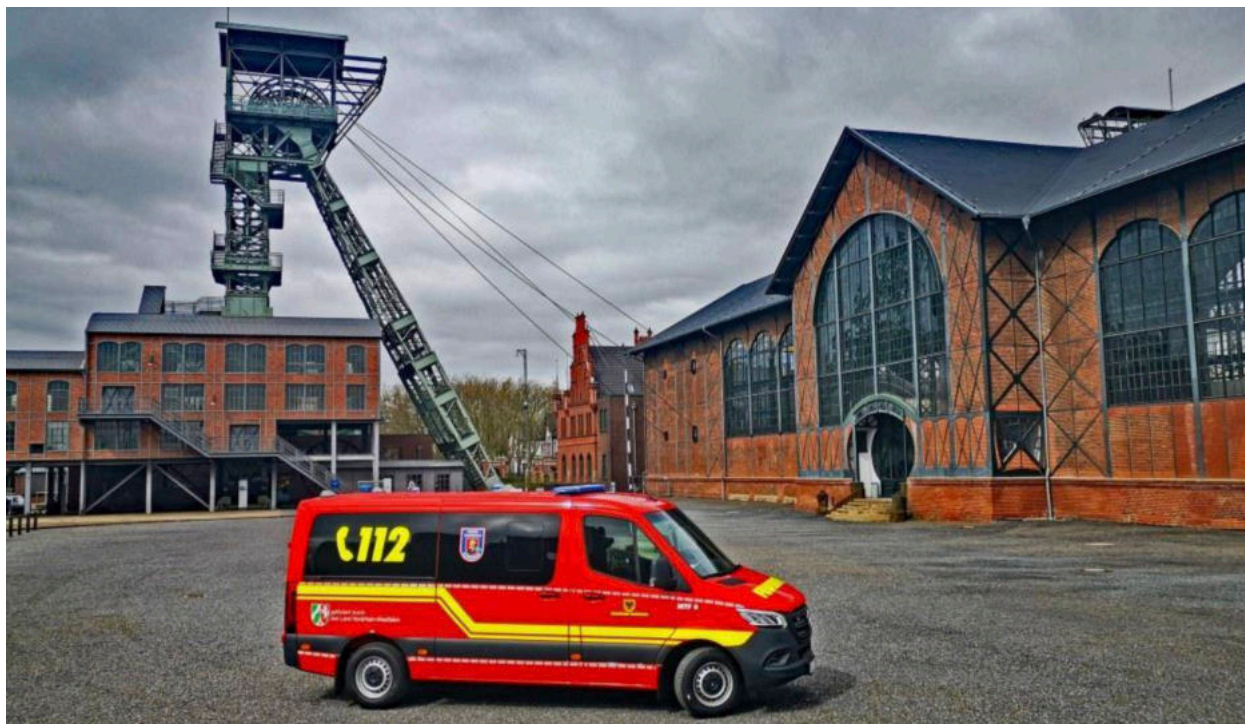
Das neue Fahrzeug der Kinderfeuerwehr vor der wunderschönen Kulisse des LWL – Industriemuseum Zeche Zollern

Pressestelle der Feuerwehr Dortmund ein ganz besonderes schönes Foto, in einer besonderen Kulisse.